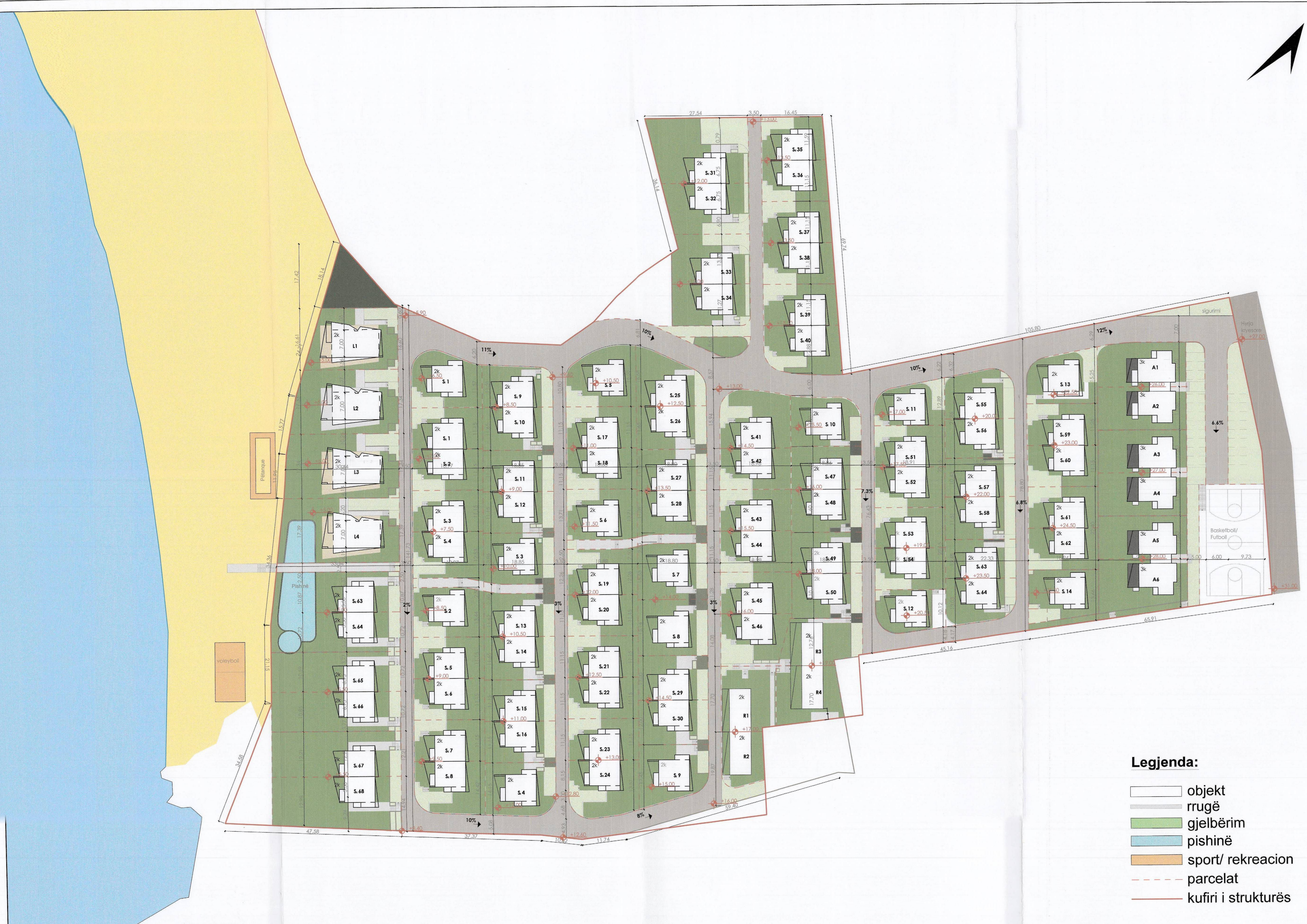
PLANI I VENDOSJES SË STRUKTURËS SHK. 1:500