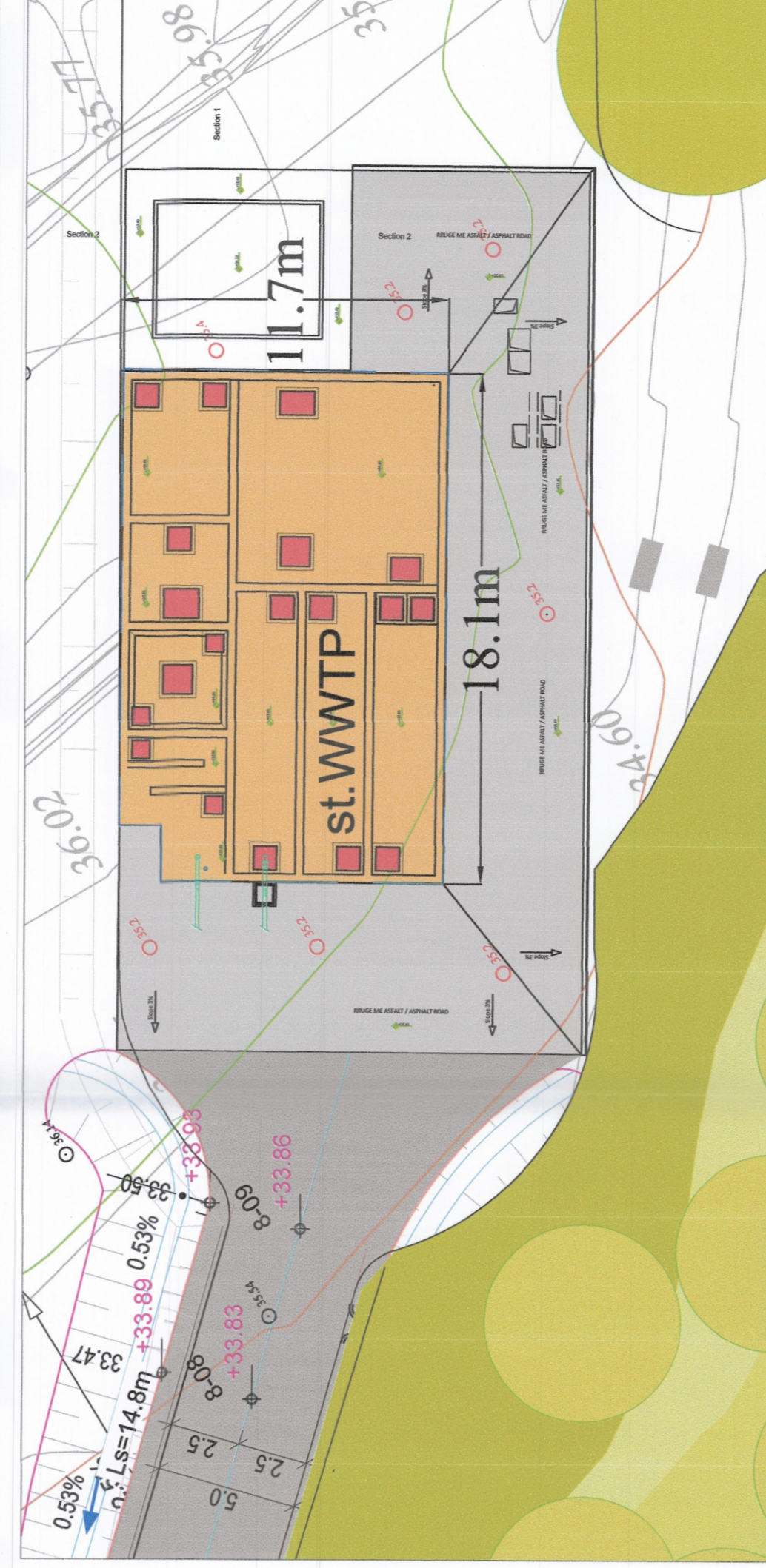
PLANI I VENDOSJES SË STRUKTURËS (IMPJANTI I TRAJTIMIT TE URAVE TE ZEZA) SHK. 1: 200