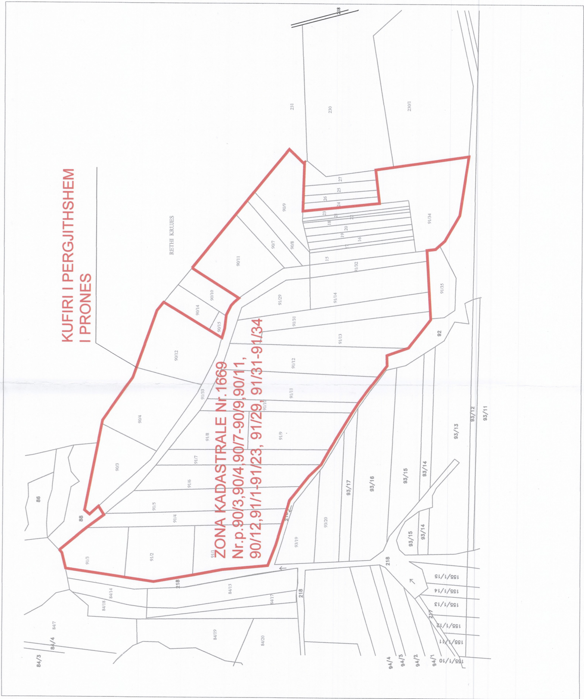
POZICIONI KADASTRAL SHK. 1:3500