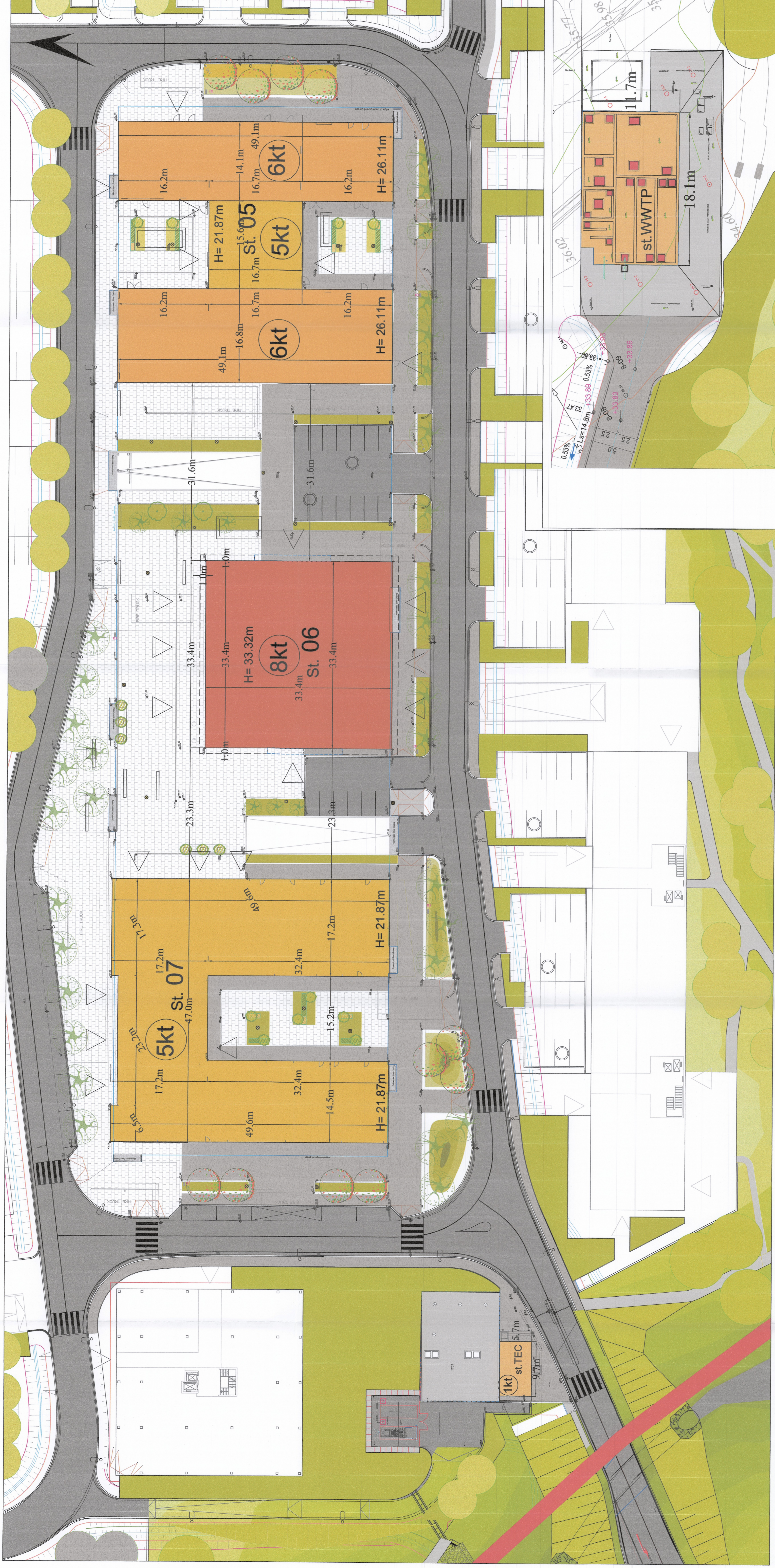
PLANI I VENDOSJES SË STRUKTURËS SHK. 1: 300

PËR MIRATIMIN E RISHIKIMIT TË KUSHTEVË DHE SHTYRJEN E AFATIT TË LEJES SË NDËRTIMIT PËR PROJEKTIN "TIRANA BUSINESS PARK", NË FSHATIN FUSHË - PREZË, KOMUNA PREZË, MIRATUAR ME VENDIM NR. 1, DATË 21.03.2011 TË KRRTRSH, "NDRYSHIMI I LEJES SË SHESHIT DHE INVESTITORIT PËR OBJEKTIN "TIRANA BUSINESS PARK" ME SIPËRFAQE SHESHI 210 566 M 2 DHE SIPËRFAQE NDËRTIMI 89 203 M 2 .