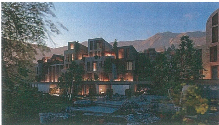
Figure 10 Pamje të njesive të hotelit