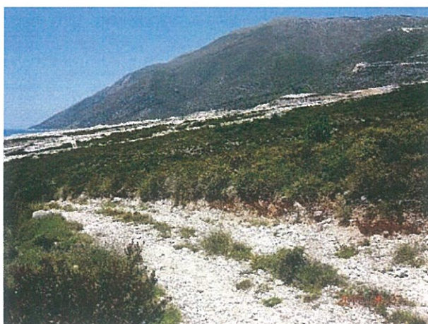
Figure 4 Pamja veri-lindore e truallit të tokës