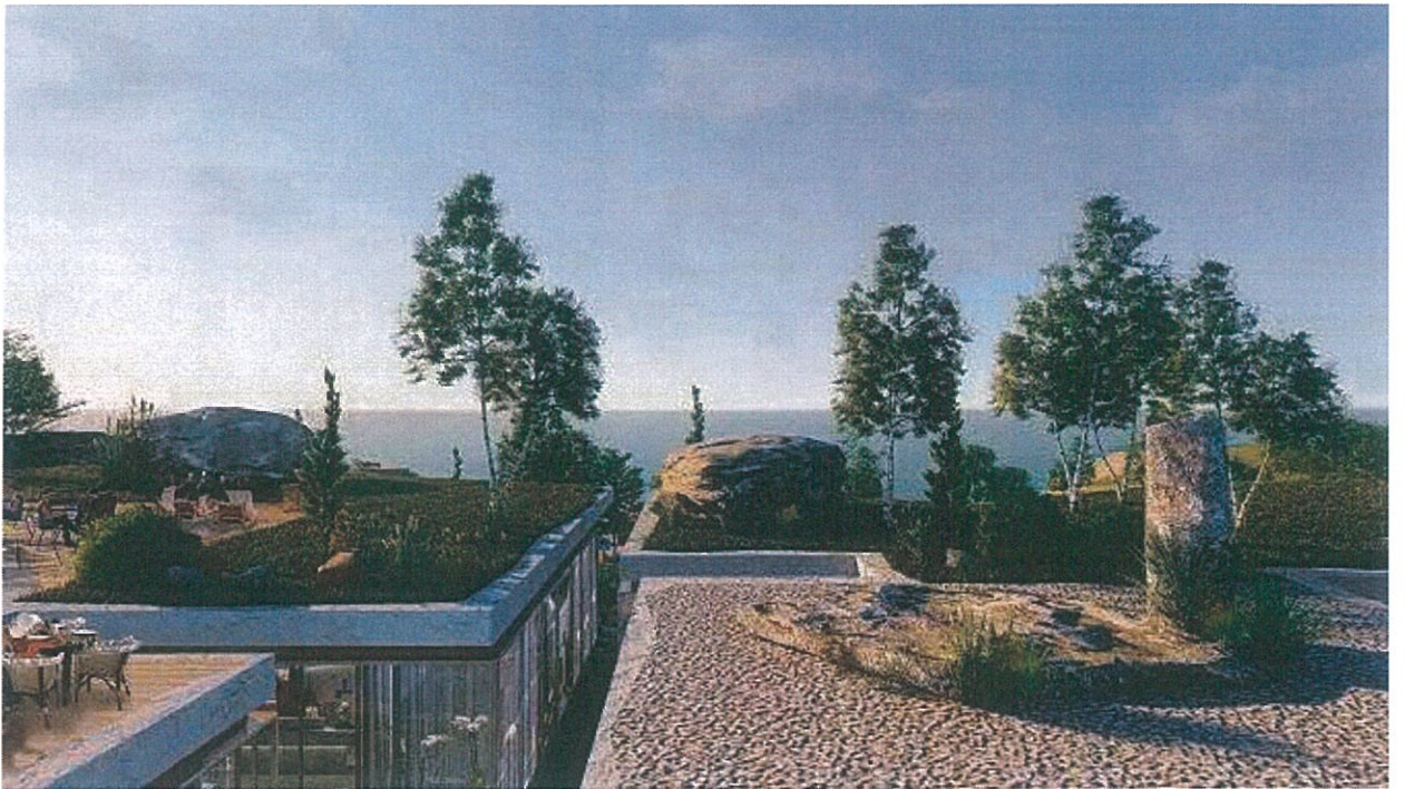
Figure 12 Pamje nga tarraca e brezit te dyte te hotelit