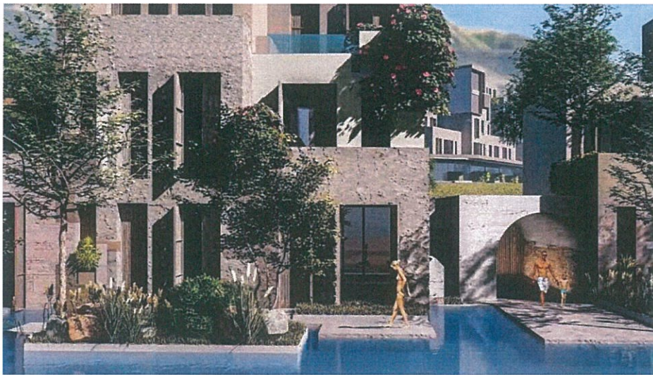
Figure 9 Pamje të njesive të hotelit

Fasadat janë të trajtuara me materiale natyrore si travertine guri dhe suvaja tipike e zonës që tenton të mimitizojë shkebin ku shtrihet kompleksi por në të njëjtën kohë të risjelle mënyrën tradicionale të ndërtimit në zonë. Kjo zgjedhje e rifiniturave bën që kompleksi të shkrihet me natyrën dhe duke u integruar me gjelberimin dhe pasqyrat ujore të krijojë ndjesinë e një mjedisi sa më natyral.