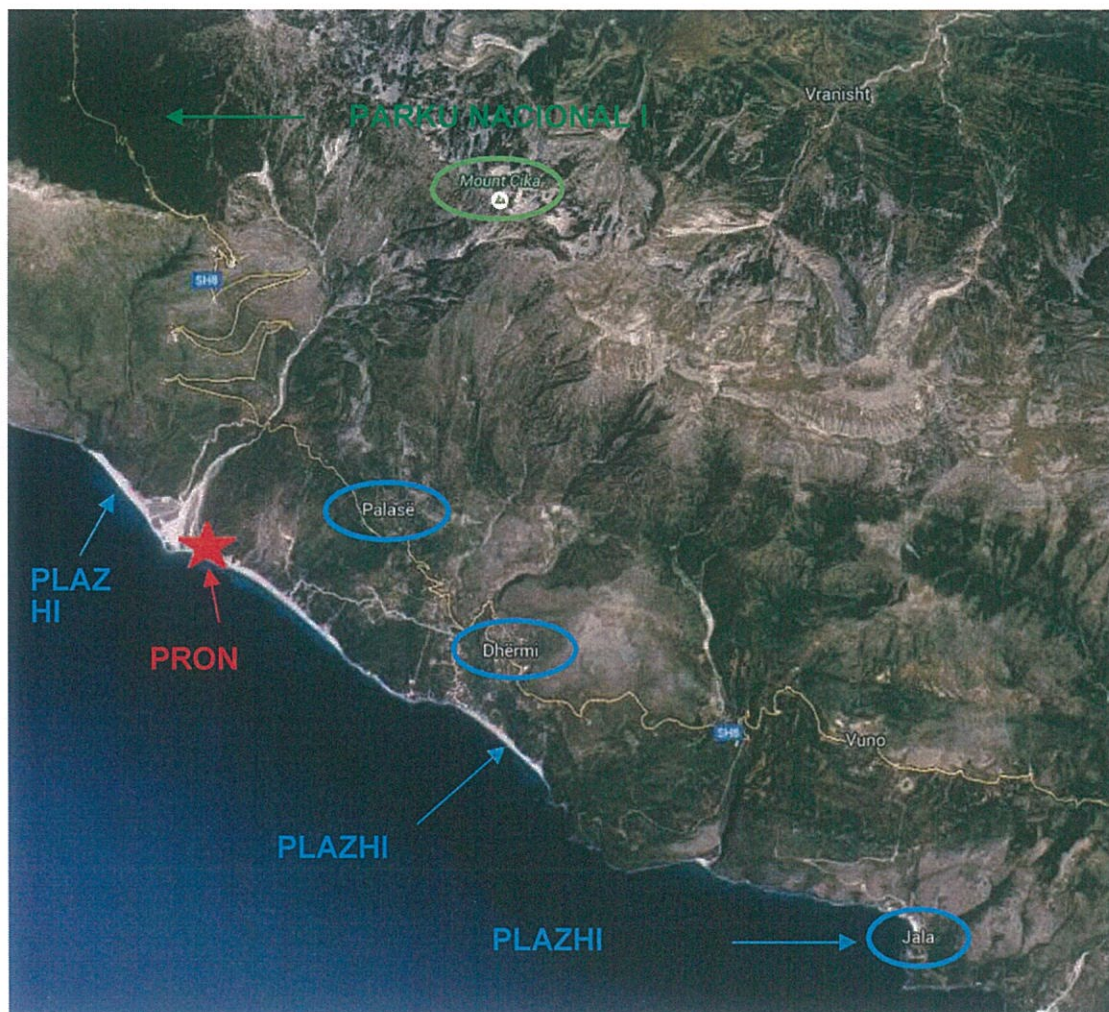
Figure 3 Pozcioni Gjeografik

Në një nivel makro, Resorti është afër Parkut Kombëtar të Llogarasë (veriperëndim) i cili ka një larmi pishash unike dhe jetë të egër në një lartësi prej 2000 m mbi nivelin e detit. Në jug-lindje, Resorti kufizohet me Dhërmiun, i cili është një nga destinacionet më të kërkuara dhe më premtuese të pushimeve të Rivierës Shqiptare.