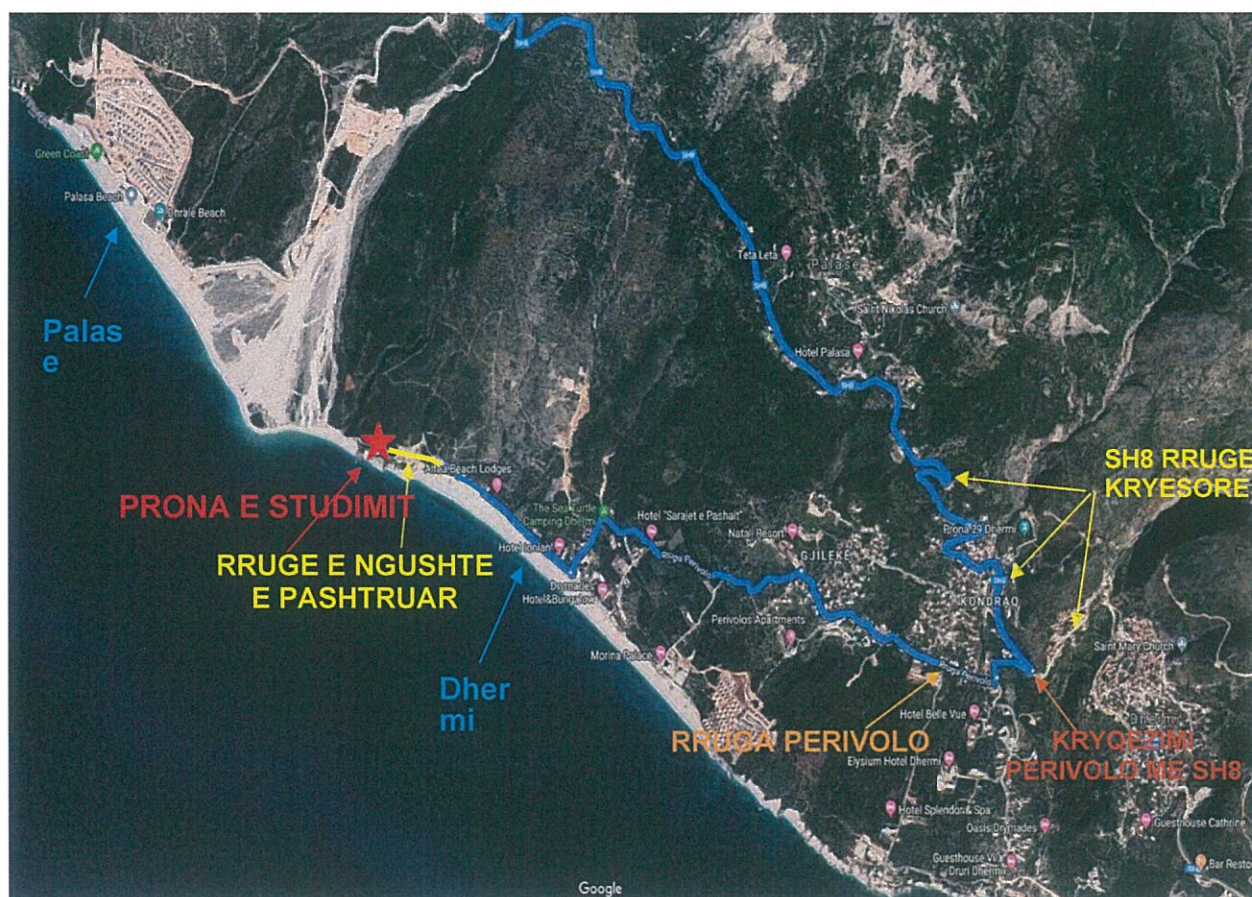
Figure 14 Mundësitë e aksesit në zonë

Mundësia e aksesibilitetit aktual të pronës së subjektit tregohet në hartën e mëposhtme.