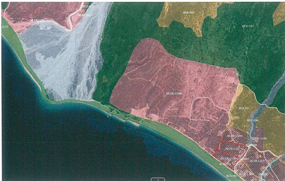
Figure 2 Fragment nga studimi i PPV-së Himarë

Kjo zonë parashikon në ndërtimin e vetë zonë shërbimesh - hotelerie në favor të zonës. Më poshtë, fragment nga studimi i PPV-së Himarë për zonën 1, ku shtrihet zona nën interes zhvillimi.