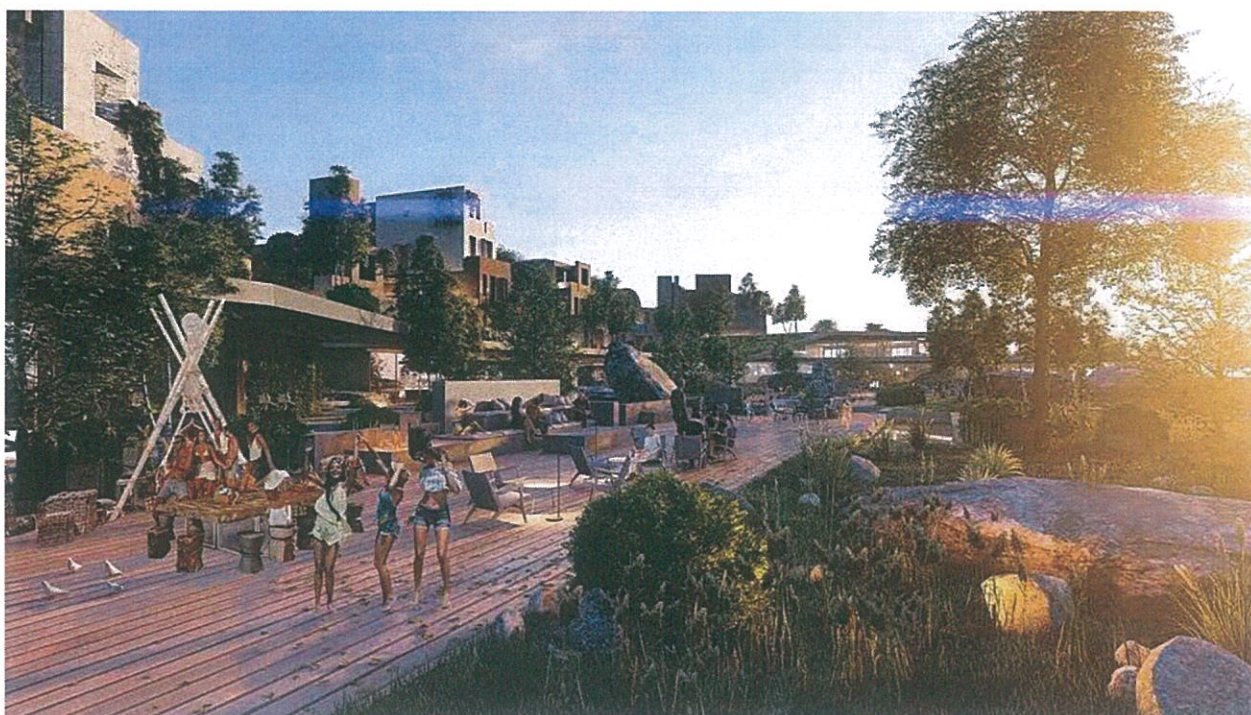
Figure 11 Pamje e hapesirave te perbashketa ne pjesen jugore

Qarkullimi ne zone parashikohet te behet kryesisht me makina te vogla (buggy), por dhe automjete. Per sa i perket qarkullimit te kembesoreve, pervec akseve kryesore te qarkullimit me automjete mendohet qe levizja e kembesoreve te behet edhe ne pjesen qendrore nepermjet shkallareve apo rampave qe nderthuren me objektet dhe hapesirat e vogla te gjelberimit te shperndara ne kompleks.