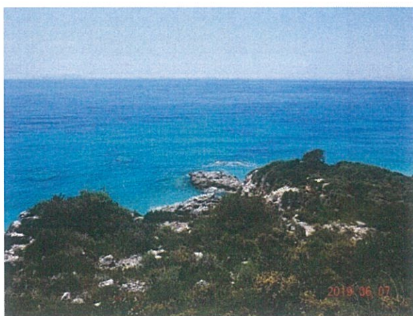
Figure 6 Pamja e anës të detit së projektit