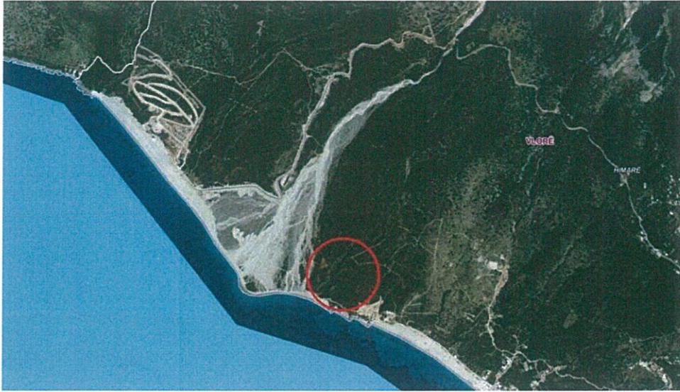
Figure 1 Pozicioni i Zones