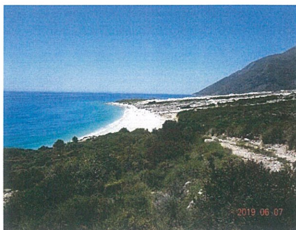
Figure 5 Pamje panoramike nga parcela e tokës së projektit