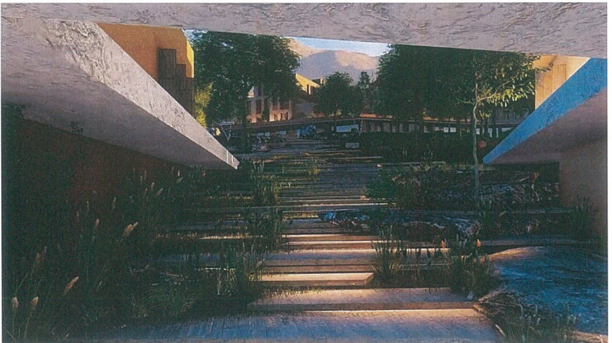
Figure 13 Pamje te shtigjeve perms hotelit